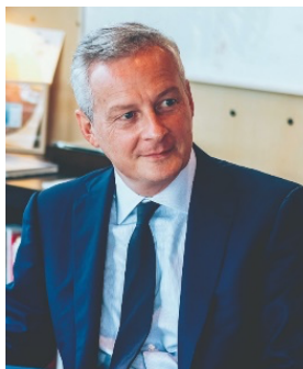
Bruno Le Maire, Ministre de l'Économie, des Finances et de la Relance